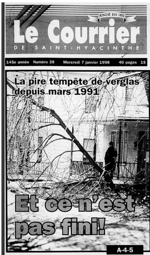
La une du Courrier de Saint-Hyacinthe.