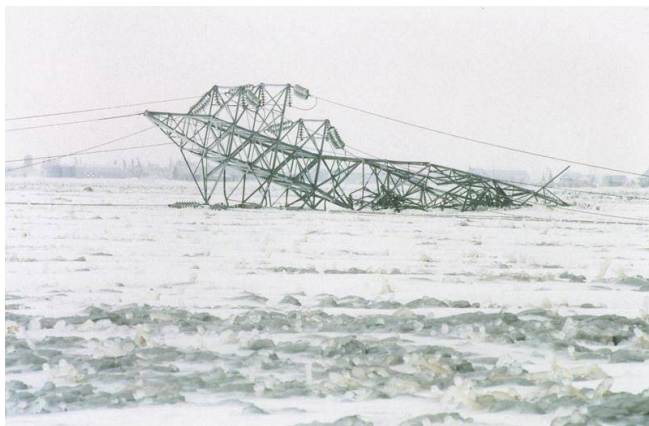
Un pylone effondré.

ministères comme au moment où on a ouvert le centre d'hébergement afin d'avoir du matériel, des lits et, bien sûr, des aliments. Il fallait l'organiser d'abord et gérer ensuite les arrivages de nourriture acheminés à la salle où les fermières cuisinaient des repas dignes d'un restaurant 5 étoiles ! Il y avait aussi du bois de chauffage qui arrivait de différents endroits de la province et les gens pouvaient venir en chercher; les soldats de l'armée et des bénévoles aidaient à sa distribution. La municipalité de Sainte-Brigitte-de-Lanoraie, où les gens n'étaient pas pris avec le verglas, était jumelée à la nôtre et nous faisaient parvenir diverses choses qu'on ne trouvait plus ici et on veillait à la coordination de tout cela. On demeurait en contact avec la Sécurité publique et la Croix rouge qui s'informaient de nos besoins. Il fallait aussi compiler toutes les dépenses et les achats parce qu'à la fin du verglas, nous devions avoir conservé toutes les pièces justificatives comme les factures et les heures de travail pour vérification auprès du ministère. »