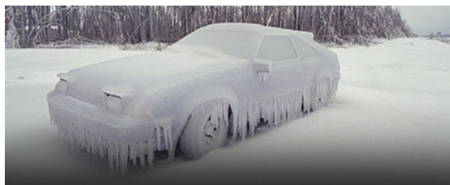
Une image saisissante.